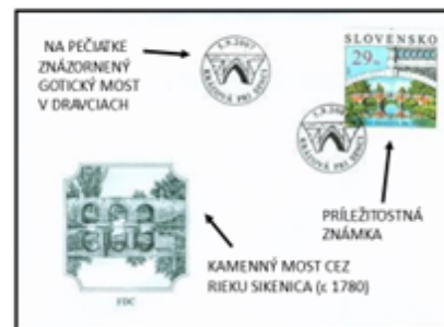
OBÁLKA PRVÉHO DŇA

„LUDIA BUDÚ ŠĀSTNÍ VTEĎY, KEĎ POSTAVIA VIAC MOSTOV AKO MŪROV“