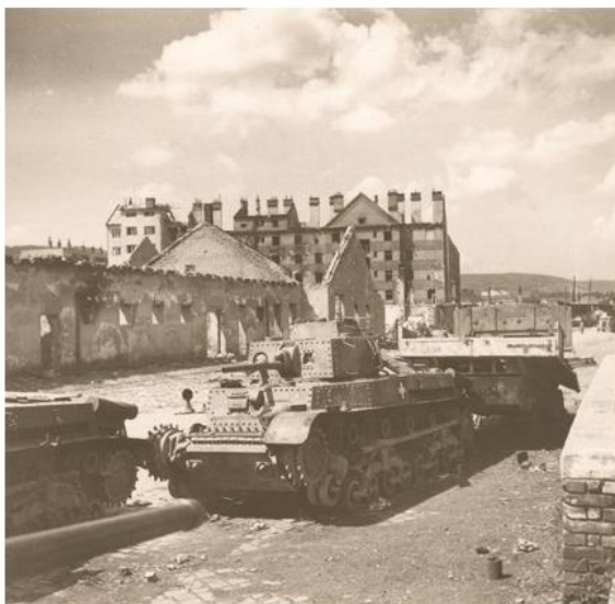
V stredu 4. apríla 1945 zaútočila Červená armáda v ranných hodinách v hlavnom smere po dnešnej Račianskej, Vajnorskej a Trnavskej ulici, z Prievozskej cesty cez Mlynské Nivy a prístav do vnútorného mesta.